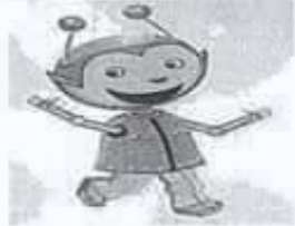
robot انسان آلي