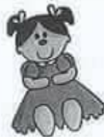
doll دميه / لعبة