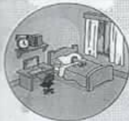
bedroom غرفة نوم