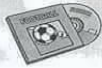
CD game لعبة سي دي