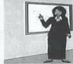
teacher معلم / معلمة