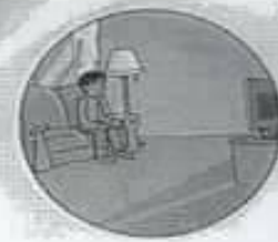
Living room غرفة جلوس