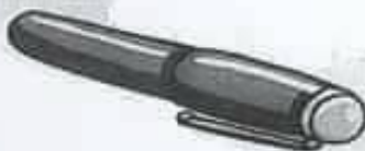
pen قلم حبر